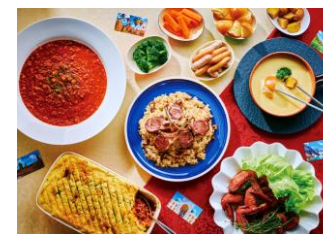
世界の料理フェアイメージ